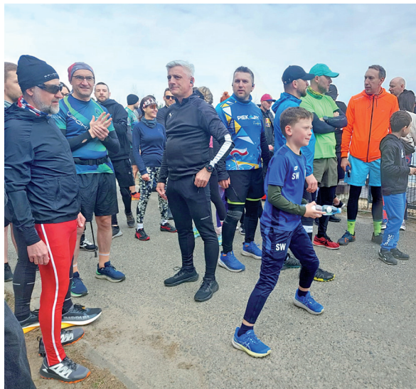
Zaledwie trzy tygodnie później, 12 kwietnia, odbyło się kolejne wydarzenie – Zdrowa